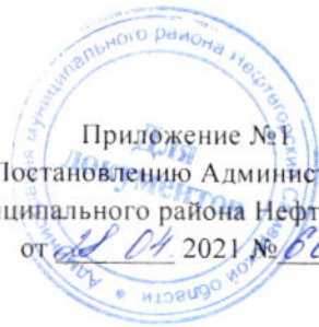
Схема границ территории городского поселения Нефтегорск для подготовки документации по планировке территории (проект планировки и проект межевания), расположенной в юго-восточной части г. Нефтегорска Самарской области